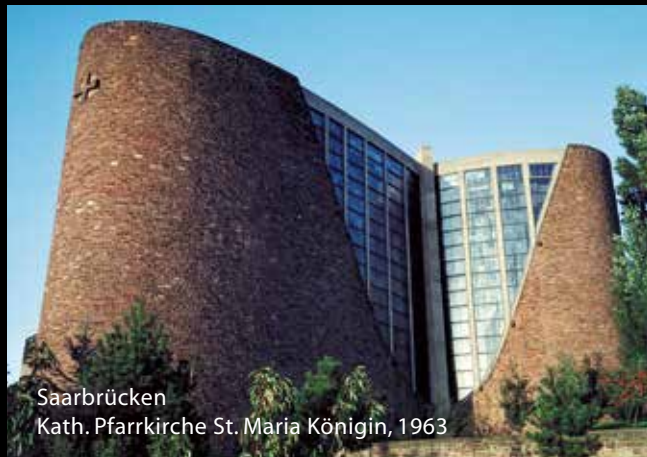
Saarbrücken Kath. Pfarrkirche St. Maria Königin, 1963

Herausragende Kirchenfensterzyklen schuf er u.a. für St. Maria im Kapitol, St. Ursula, St. Agnes und St. Gereon in Köln, die Paulskirche in Frankfurt, Maria Königin in Saarbrücken (Architekt: Rudolf Schwarz), die apostolische Nuntiatur in