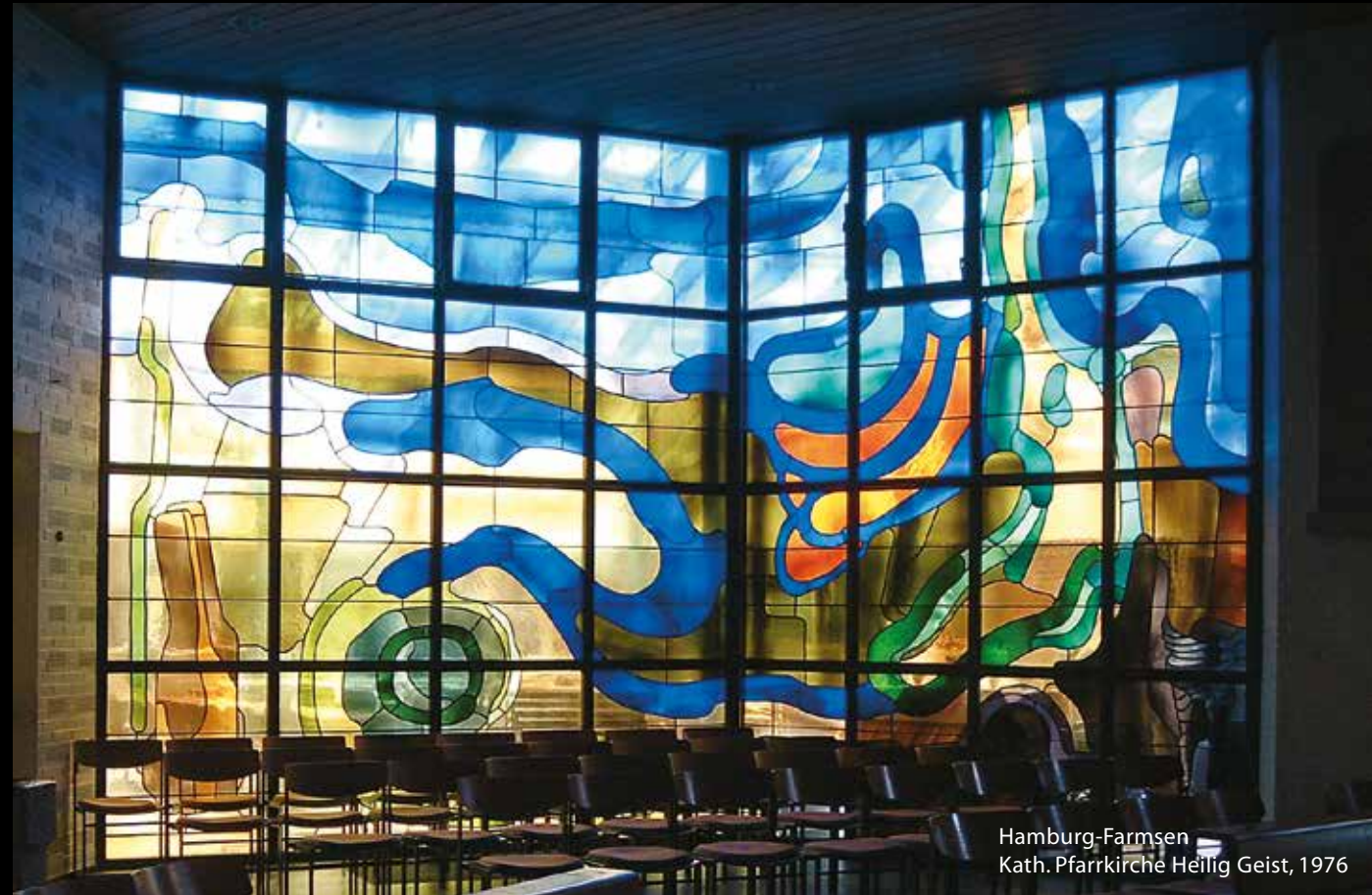
Hamburg-Farmsen Kath. Pfarrkirche Heilig Geist, 1976